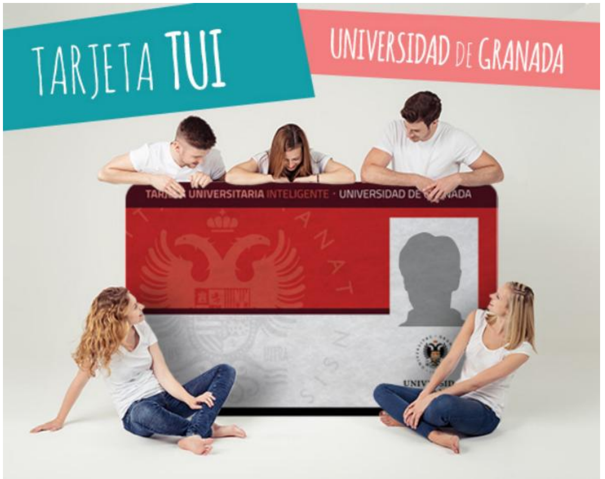
Tarjeta Universitaria Inteligente (TUI)