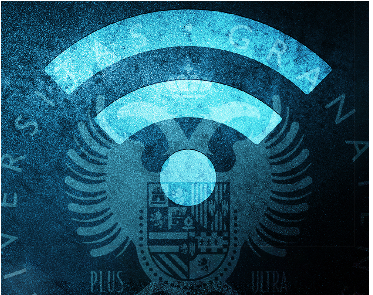
CVI-UGR (Wi-Fi universitaria)